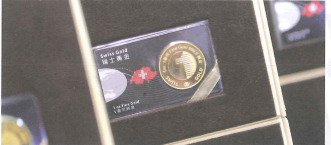
▲ 第一金信用金幣將以人民幣定價發售。 First Gold's coin, denominated in Renminbi, will be available for sales.